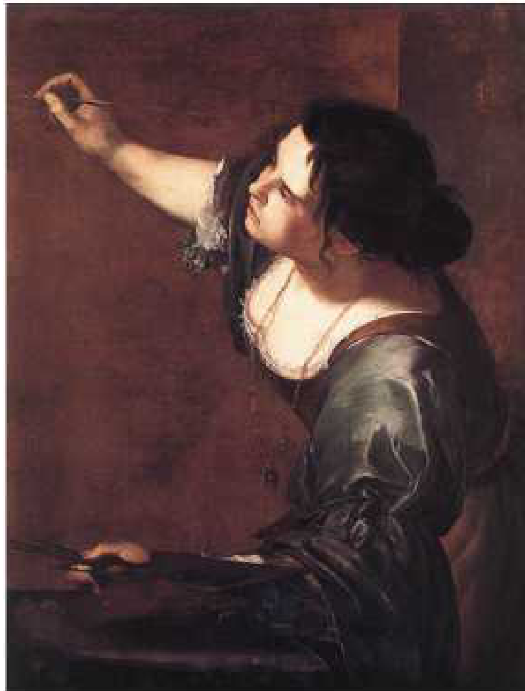
Артемизия Джентилески. Автопортрет в виде аллегории Живописи. 1630-е. Холст, масло. Королевское собрание, Виндзор

Начало биографии Артемизии Джентилески было, впрочем, вполне традиционным для большинства женщин-художниц: она была дочерью живописца, причем весьма значительного — Орацио Джентилески (1553—1639), одного из наиболее оригинальных последователей Караваджо в Италии. Понятно, что отец был первым учителем Артемизии, очень рано проявившей способности к живописи: вполне профессиональная картина «Сусанна и старцы» датирована 1610 годом, соответственно, художнице было тогда 17 лет. (До сих пор нет единого мнения по поводу атрибуции картины, некоторые искусствоведы полагают, что она была