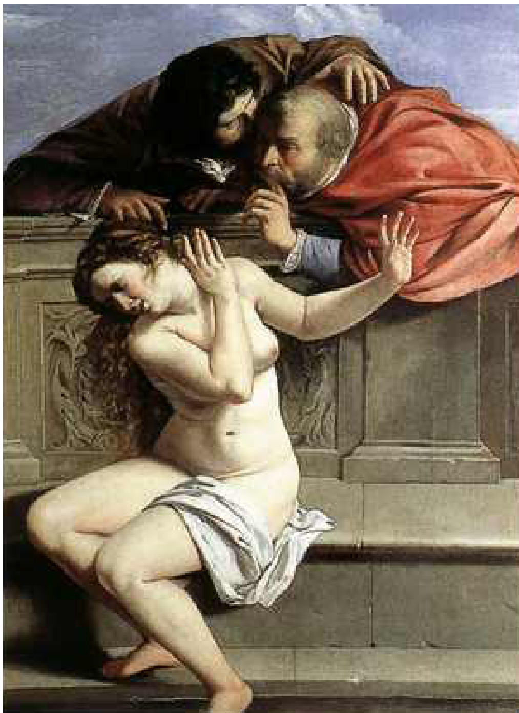
Артемизия Джентилески. Сусанна и старцы . 1610. Холст, масло. Замок Вайсенштайн. Поммерсфельден

написана отцом Артемизии, или он, по крайней мере, принимал участие в ее написании. Впрочем, в подписи значится достаточно определенно: «Артемизия Джентилески»).