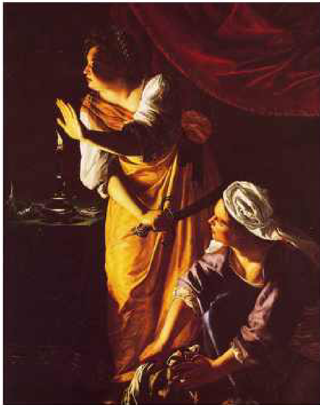
Артемизия Джентилески. Юдифь со служанкой. 1625. Институт искусств. Детройт